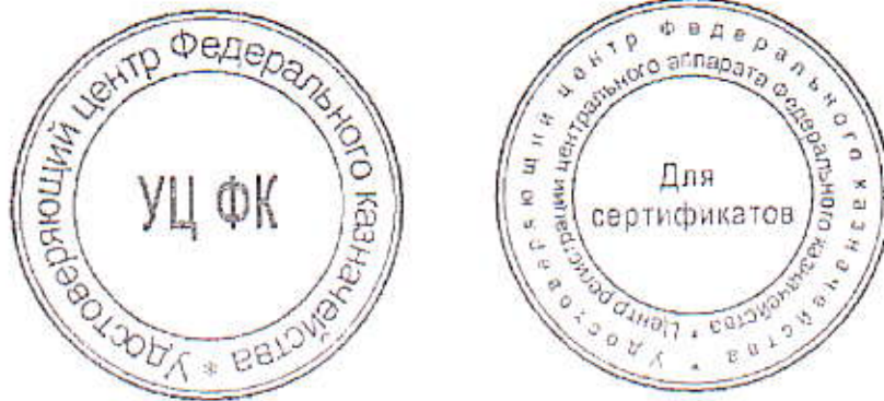
Образцы печатей Регионального центра регистрации территориального органа Федерального казначейства (на примере УФК по Нижегородской области)